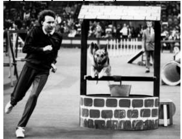
Рис. 4. Одні з перших змагань з аджилити 1970-ті

Аджилити - відносно новий вид спорту з собакою, який був винайдений в Англії в кінці 70-х років і стрімко набирає популярність у всьому світі (рис.4.).