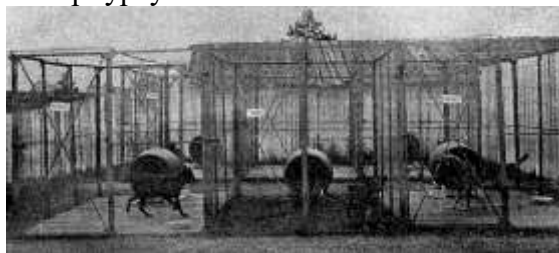
Рис. 2. Перший розплідник поліцейських собак Санкт-Петербург 1909 р

У Росії поліцейських собак стали використовуватися в кінці XIX століття. Перший розплідник поліцейських собак були відкриті в Санкт-Петербурзі в 1909 році (рис.2.), і цей рік вважається роком підготовки розплідника кримінальної поліції Петербургу.