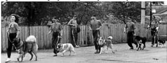
Рис. 5. Показові виступи «Зотер» 1994 р.

Назва та символіка центру були запропоновані Веронікою Висоцької - в пам'ять про легендарну охоронну собаку.