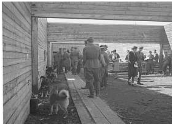
Рис.1. Самий старий кінологічний клуб «Kennel Club» 1873 р.

користанню дослідницьких собак в боротьбі зі злочинністю в Німеччині, інтерес до спеціально навченим собакам почав зростати.